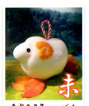
平成27年 つばさ オリジナル平支土鈴