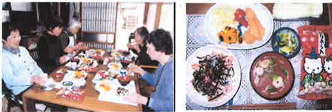
楽しいひなまつりです♪

場所、参加者は変わっても、楽しみにされている方のため、100回を目指そうかと話し合っています。