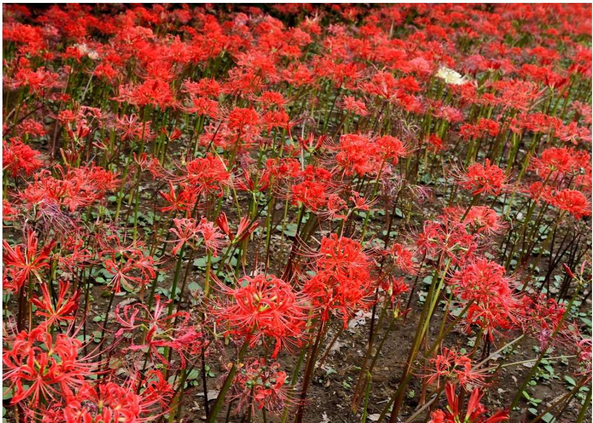
高幡山金剛寺の彼岸花 2 (早咲き種は見頃過ぎで残念。、花茎は茶色でした、)