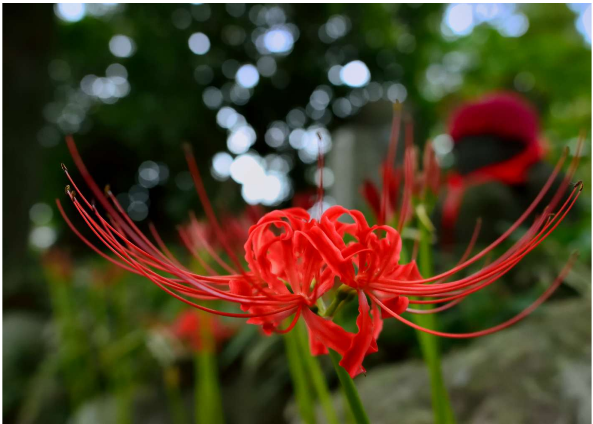
高幡山金剛寺の彼岸花 1 (お地蔵さんにお似合いです)