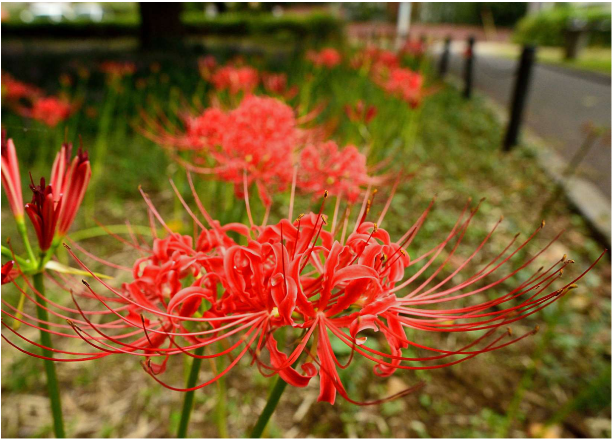
大木島自然公園の彼岸花 1 (未開花の花茎もいっぱい)