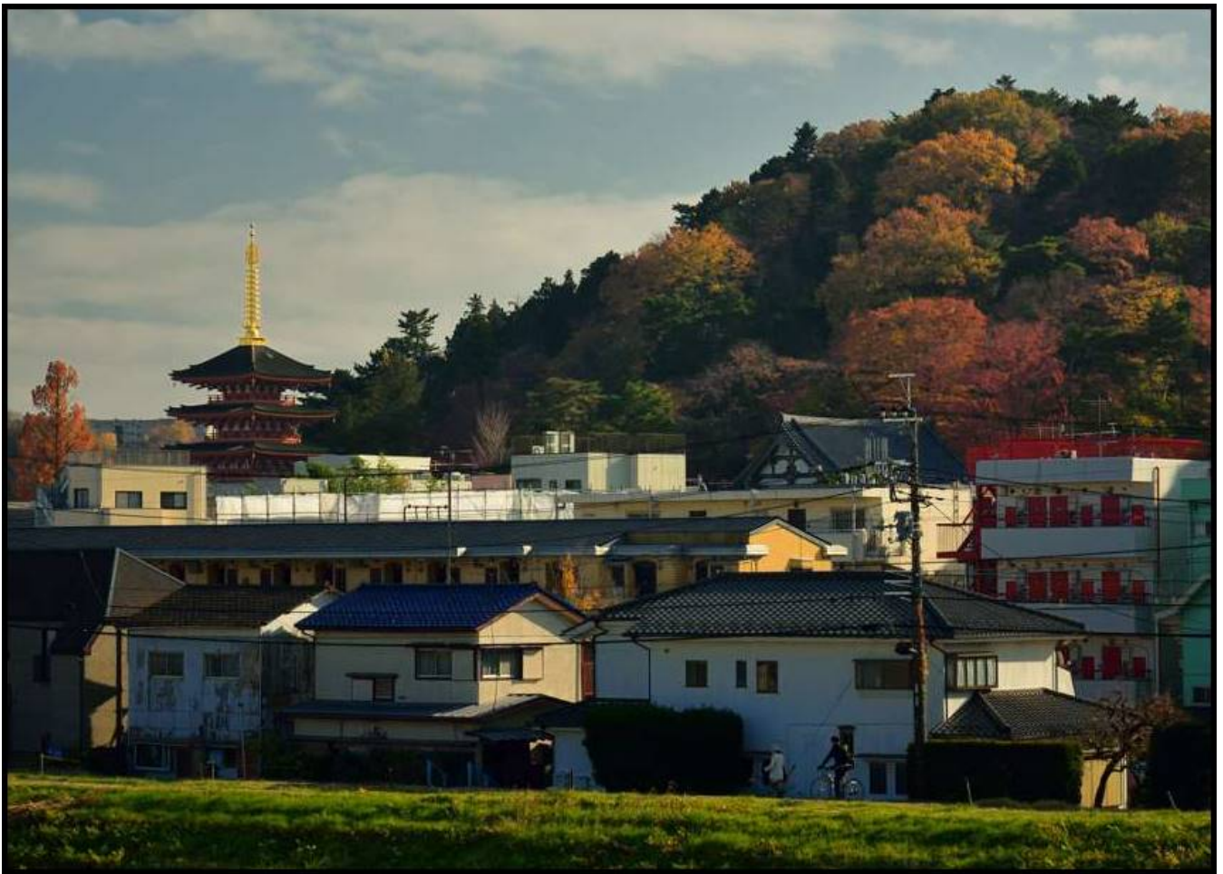
高幡橋から臨む高幡山金剛寺，不動ヶ丘の遠景